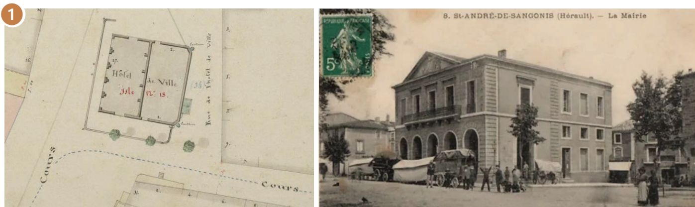
Ci-dessus : à gauche, extrait du plan d'alignements de 1856-1865 (AD34) sur lequel apparaît l'hôtel de ville nouvellement construit.

pour la réalisation d'un bâtiment regroupant plusieurs fonctions : halle de commerce et école au rdc, mairie à l'étage (logement de l'instituteur ?). D'autres travaux interviennent en 1888 (couvrement de la halle par un plancher métallique) mais l'ensemble garde une architecture cohérente qui fait écho à un type de réalisation répandu au XIX e s. (dans la région, voir la mairie-halle de St Laurent d'Aigouze par exemple).