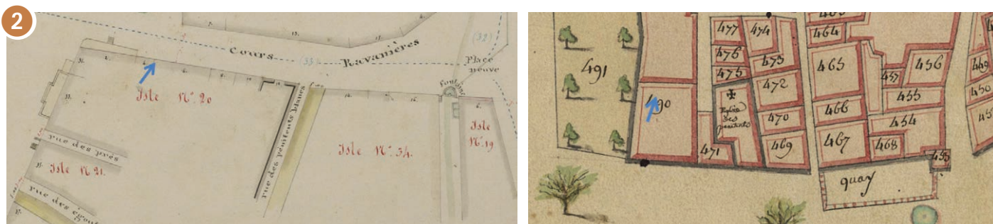
Ci-dessus : plans de 1779 à gauche et de 1856-1865 à droite ; les flèches bleues localisent les emplacements successifs des Pénitents.